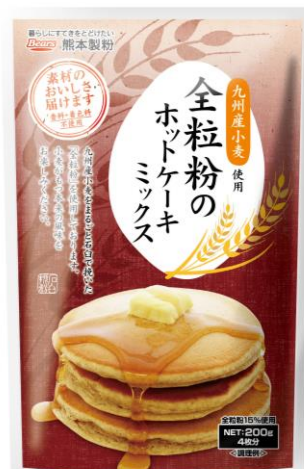
全粒粉のホットケーキミックス