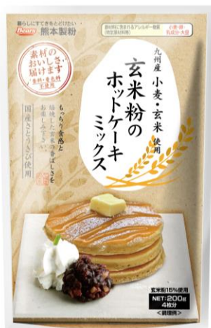
玄米粉のホットケーキミックス